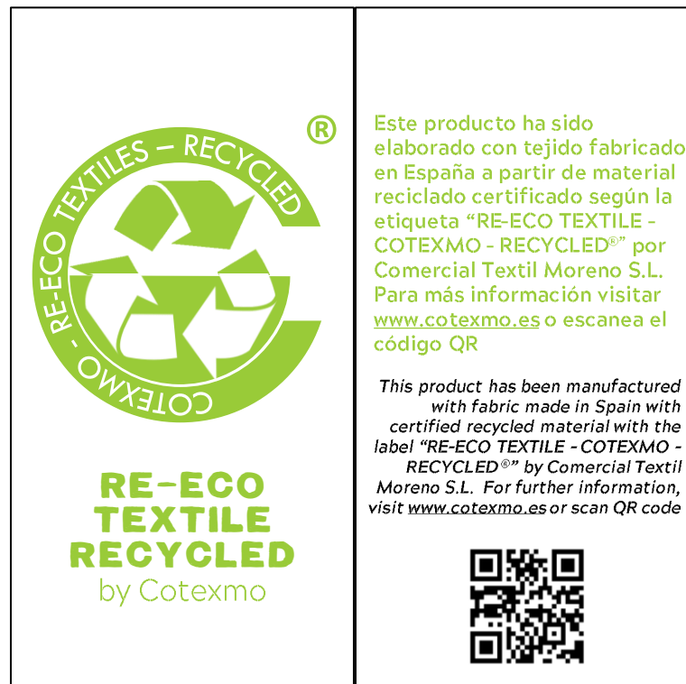
Figura 4: Etiquetas físicas (anverso y reverso). Estarán impresas en papel Kraft reciclado, troqueladas para usar un navet y tendrán un tamaño de 50x100 mm

Las etiquetas proporcionadas por Comercial Textil Moreno S.L. no se podrán modificar ni duplicar e irán en los productos fabricados con tejido certificado, no se podrán aplicar sobre otros productos ni sobre mezclas sin consentimiento expreso.