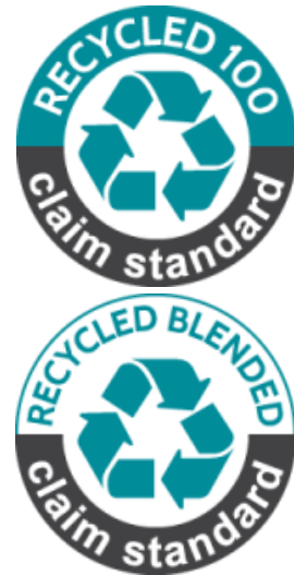
Figura 3: Logotipo RCS. Recycled 100 y Recycled Blended respectivamente

Además de las certificaciones externas, por nuestros principios de transparencia y confianza, establecemos un contrato por el cual nuestro proveedor auto-certifica que el material es al menos un 40% reciclado. Se realiza este procedimiento en proveedores de confianza a los cuales les supone un problema certificar cada partida de hilo por separado, pero que nos aseguran (mediante un contrato) que sus hilados pasarían cualquiera de estas certificaciones. Para esta