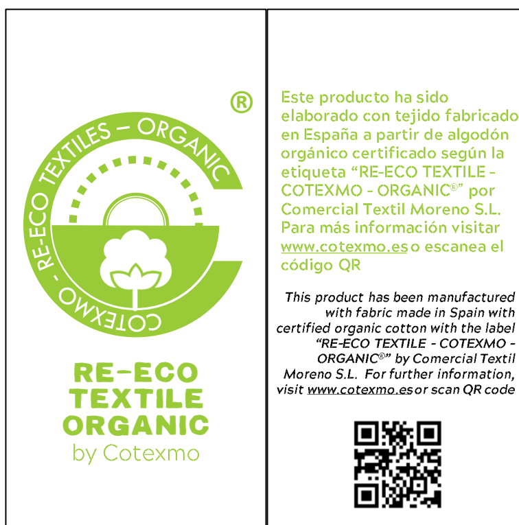
Figura 4: Etiquetas físicas (anverso y reverso). Estarán impresas en papel Kraft reciclado, troqueladas para usar un navet y tendrán un tamaño de 50x100 mm

Las etiquetas proporcionadas por Comercial Textil Moreno S.L. no se podrán modificar ni duplicar e irán en los productos fabricados con tejido certificado, no se podrán aplicar sobre otros productos ni sobre mezclas sin consentimiento expreso.