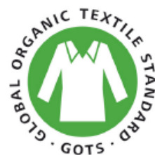
Figura 2: Logotipo GOTS