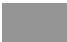
17-Gris Medio (No Orgánico)